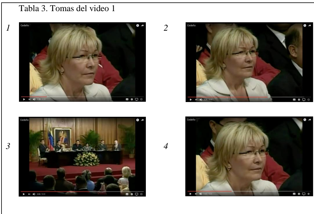
Tabla 3. Tomas del video 1

Chávez utiliza, seguramente con un cambio de entonación, una cita prospectiva en estilo indirecto en la que presenta una justificación que no ha tenido lugar, es decir, pone en boca de los otros lo que dirían hipotéticamente. Como explica Escribano (2013: 22), tal vez sea esa necesidad de salvaguarda social lo que hace que nuestras intervenciones tengan que sustentarse en puntos de vista diferentes a los nuestros, bien como apoyo argumentativo, o bien para distanciarnos y disentir con respecto a ellos, como ocurre en el ejemplo 39 .