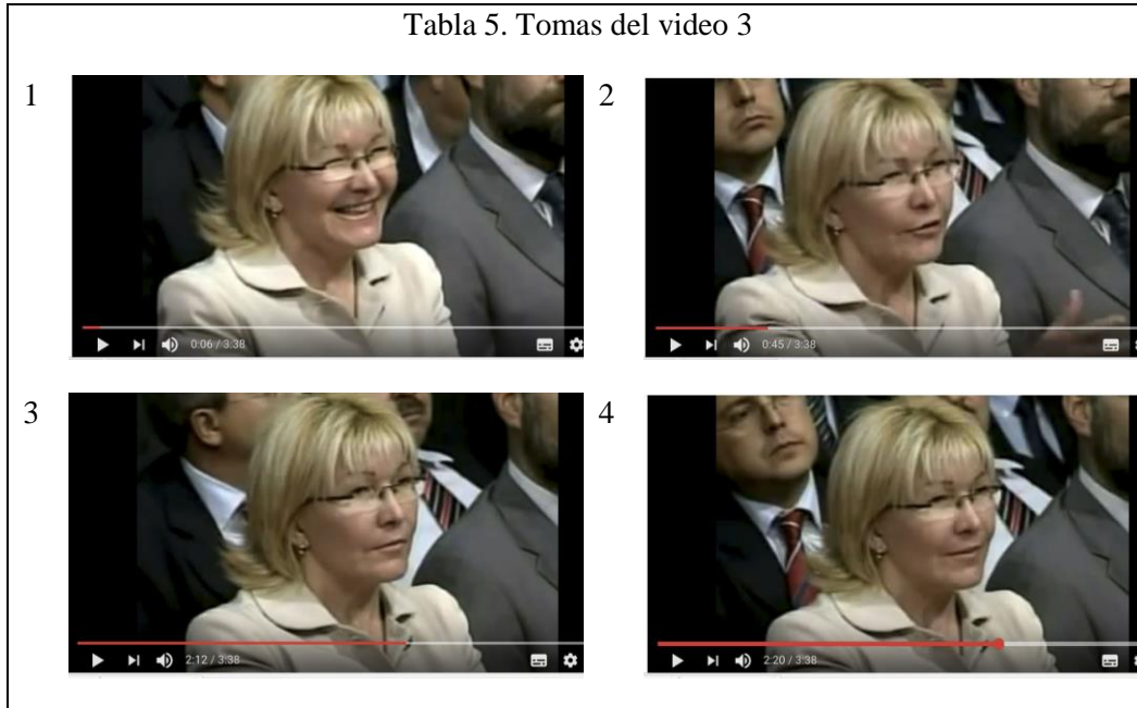
Tabla 5. Tomas del video 3