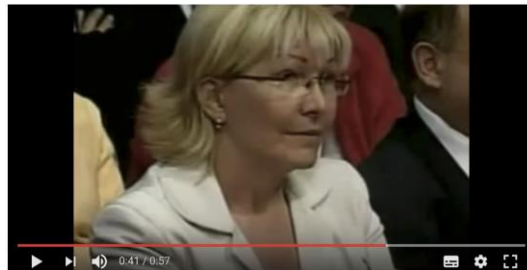
Tabla 4. Toma del video 2

La Presidenta del Tribunal Supremo mira fijamente al mandatario en los minutos 0.40 a 0.45 del video. Sonríe levemente de compromiso, apenas con los labios (Ekman et al. 2005).