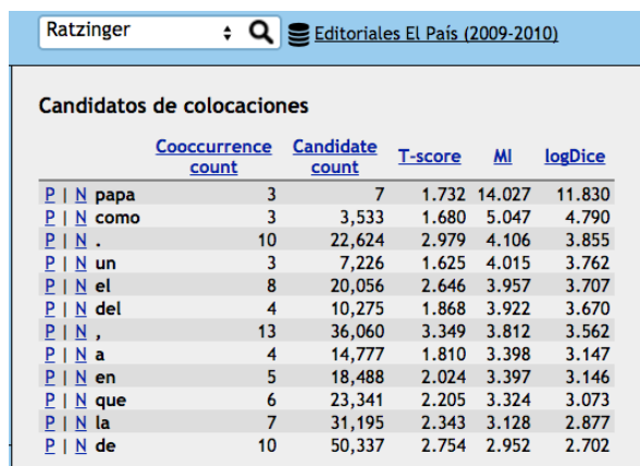
TABLA 6. Candidatos a colocación del término «Ratzinger» en editoriales de El País .

A continuación, se ofrecen los candidatos a colocación de «Ratzinger» de los editoriales de los cuatro periódicos. Se empieza por mostrar los de El País (TABLA 6).