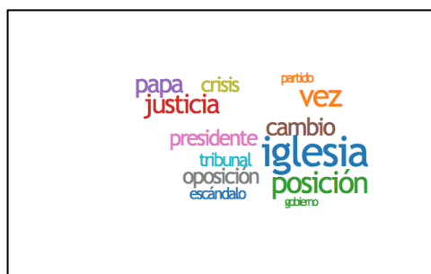
FIGURA 1. Lemas de «jerarquía» en editoriales de El País .

A modo de ejemplo, del término «Jerarquía» se hallaron los siguientes lemas 3 (FIGURA 1):