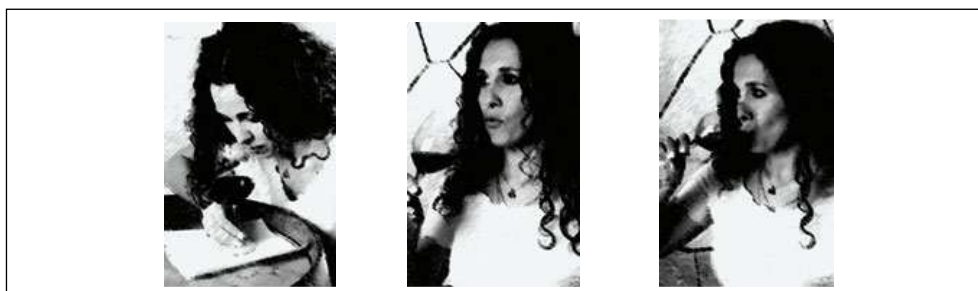
Gráfico 2: Apoyo paratextual a la función directiva en Aromas. Cómo percibir correctamente los aromas de un vino. Parte II

Uno de los principios básicos del diseño de sitios web es establecer una metáfora de interfaz unificada: